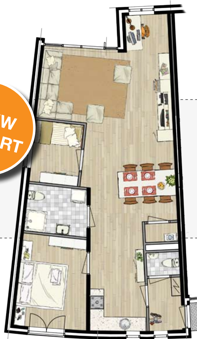
Inrichtingsimpressie hoekappartement begane grond