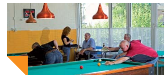
Buurthuis De Hoeve